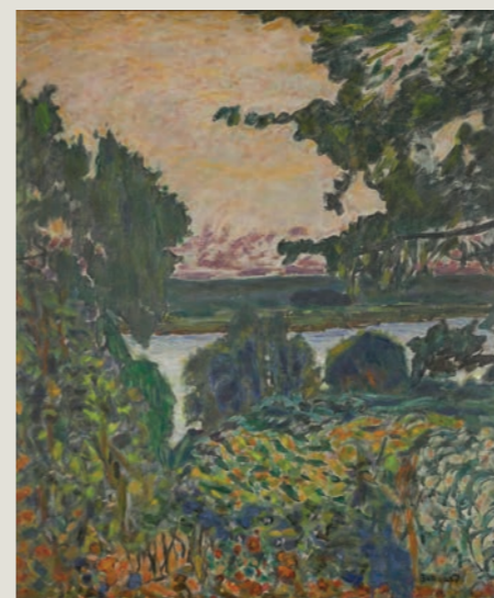
Pierre Bonnard (1867-1947), La Seine à Vernon, 1915 Huile sur toile, 80 x 68 cm. Giverny, musée des impressionnistes, acquis grâce à une souscription publique et l'aide du Cercle des Mécènes du musée des impressionnistes Giverny, de la Société des amis du musée et de nombreux donateurs individuels, 2019

À l'été 2025, le musée des impressionnistes Giverny expose sa collection à travers une exposition sur les jardins. Claude Monet, Gustave Caillebotte, Pierre Bonnard ou plus récemment Joan Mitchell, ont traité cette thématique à travers des œuvres spectaculaires, poétiques et immersives.