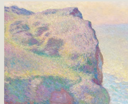
Claude Monet (1840-1926), La Pointe du Petit Ailly, 1897 Huile sur toile, 73,5 x 92,7 cm, Collection Nahmad

Au printemps 2025, le musée des impressionnistes Giverny présente une sélection d'une des collections privées les plus prestigieuses au monde. De Monet à Picasso, de Degas à Bonnard, les peintures des plus grands noms de l'histoire de l'art de la fin du XIX e et du début du XX e siècle seront ainsi exceptionnellement proposées au public.