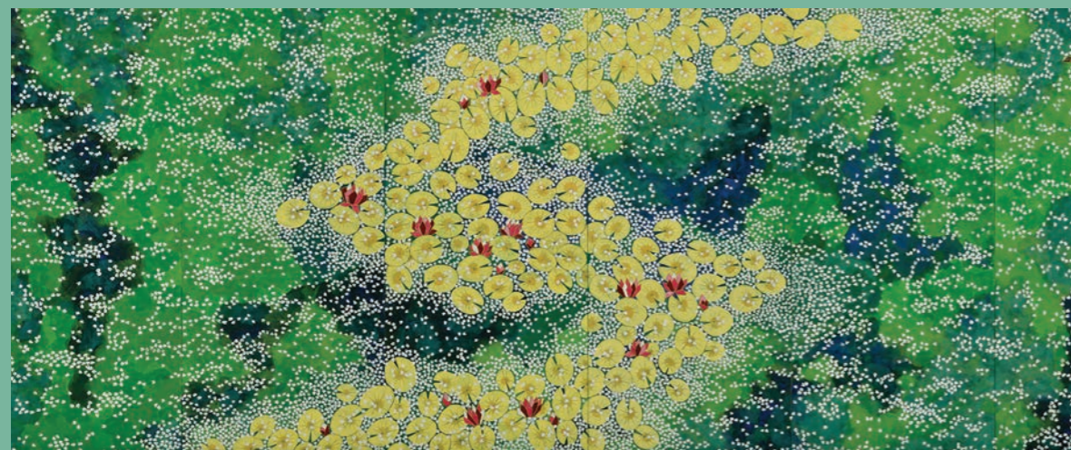
Hiramatsu Reiji (né en 1941), Concerto de nymphéas et de cerisiers (détail), 2020, Giverny, musée des impressionnistes

Parution : juillet 2024 Tarif : 14,90€ Nombre de pages : 48 pages